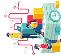
fase 2 onderzoek