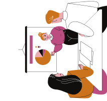
fase 1 introductie